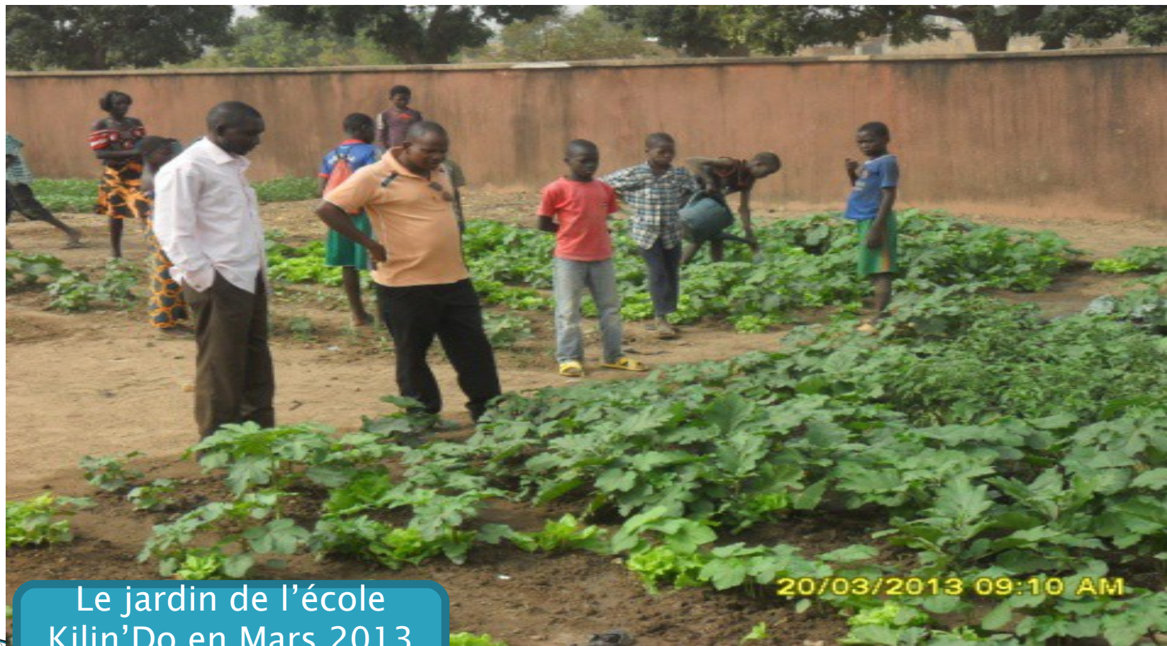
Le jardin de l'école Kilin'Do en Mars 2013