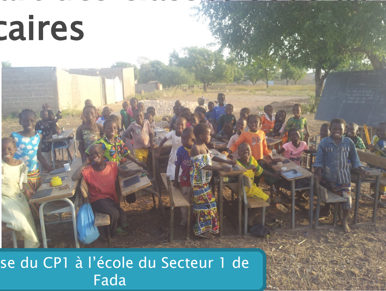
Classe du CPI à l'école du Secteur 1 de Fada